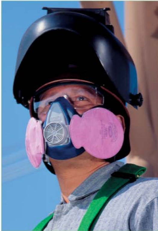
Advantage 200 LS con FLEXifilter